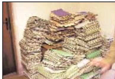
Sudovi su bili pretrpani zaostalim slučajevima

svu dokumentaciju o tom predmetu. Dokumenta predmeta su ranije zaprimana pod različitim brojevima na različitim lokacijama, a uvid u tu dokumentaciju je sudijama oduzi-