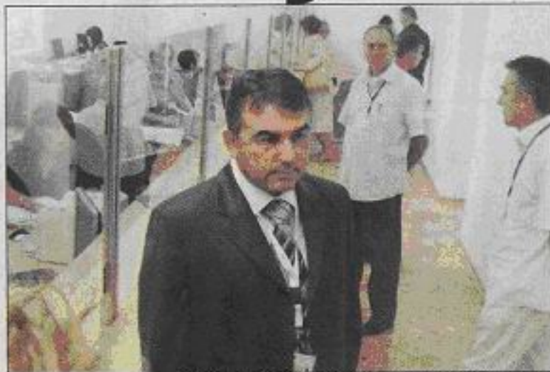
Salihović: Obnovit će Principovu sudnicu