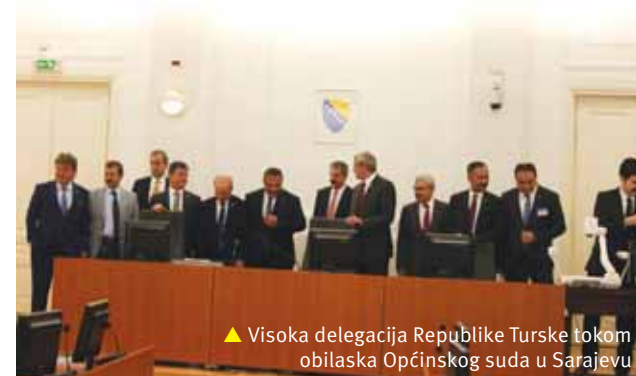
▲ Visoka delegacija Republike Turske tokom obilaska Općinskog suda u Sarajevu