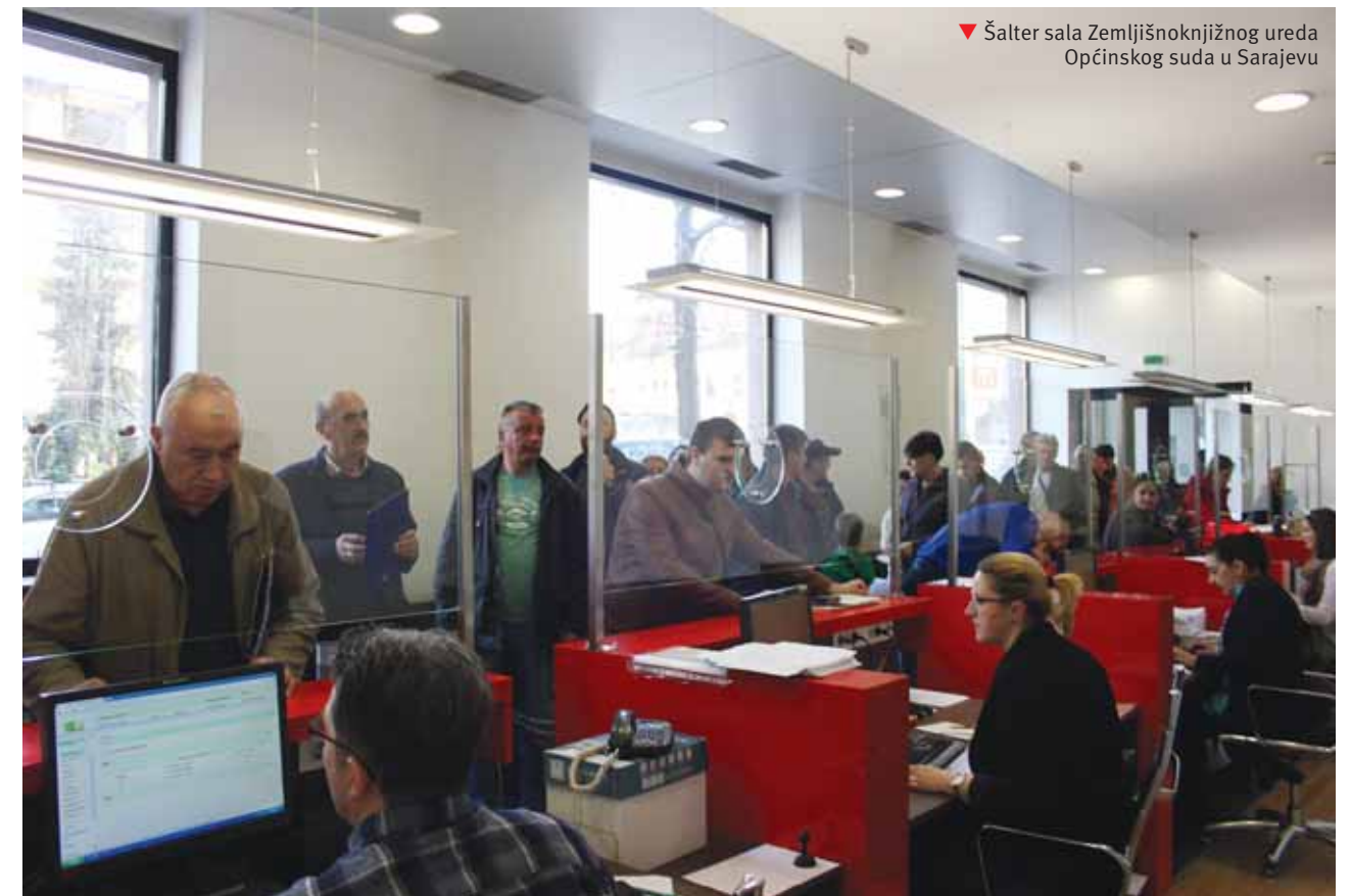
▼ Šalter sala Zemljišnoknjižnog ureda Općinskog suda u Sarajevu

U toku izvještajnog perioda se intenzivno radilo i na rješavanju Mal Kom predmeta koji nisu zavedeni u CMS sistemu te je ovo Odjeljenje uz dodatno angažovanje svih uposlenika u 2017. godini riješilo 5.882 ovakvih predmeta.