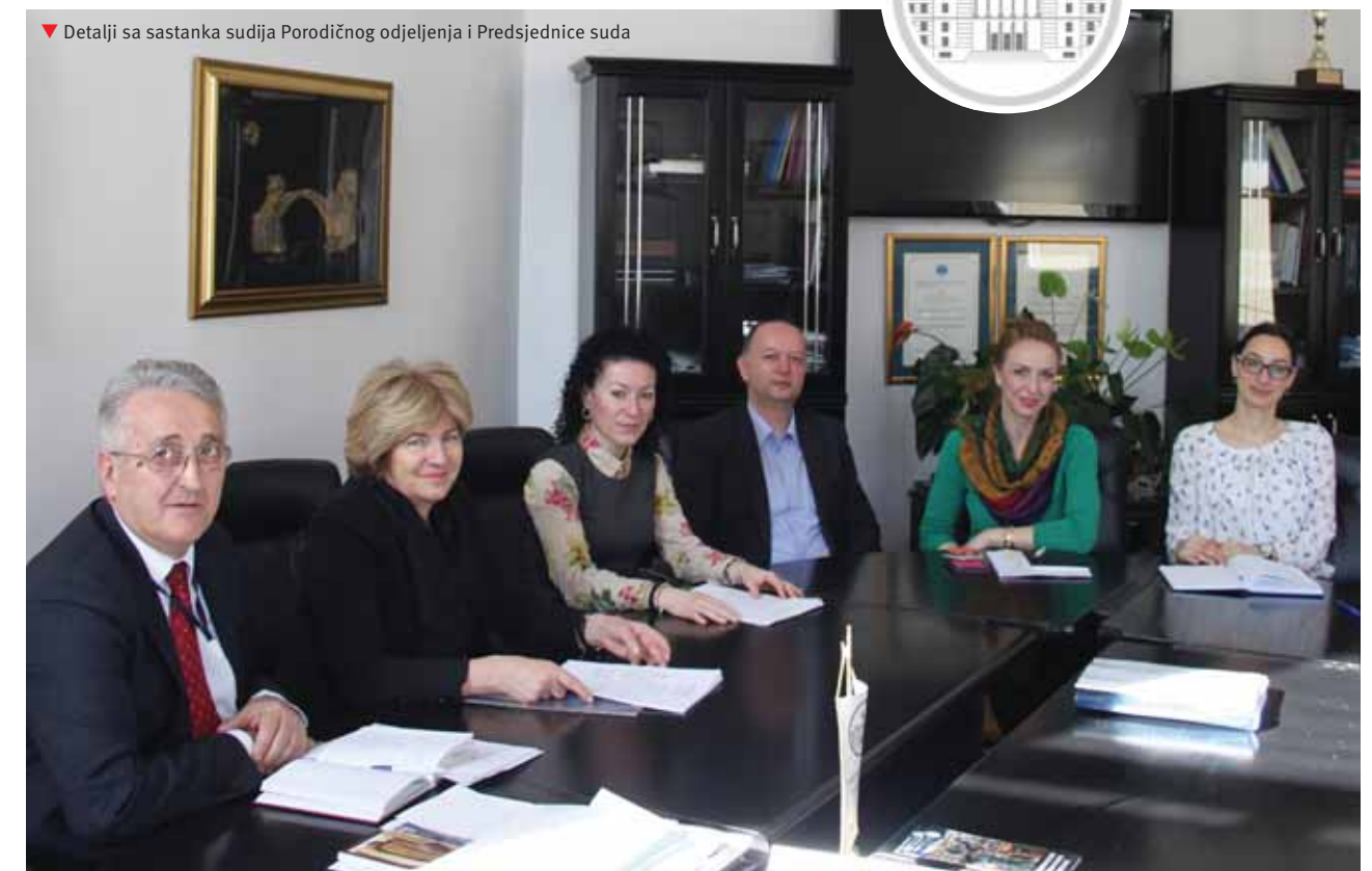
▼ Detalji sa sastanka sudija Porodičnog odjeljenja i Predsjednice suda

7.552 neriješenih predmeta, od čega 7.453 radna spora, a 99 predmeta iz građansko-pravne oblasti koji su preostali iz ranijih referata sudija. Tokom godine primljeno je ukupno 2.762 predmeta što je u odnosu na 2016. godinu manje za 48%.