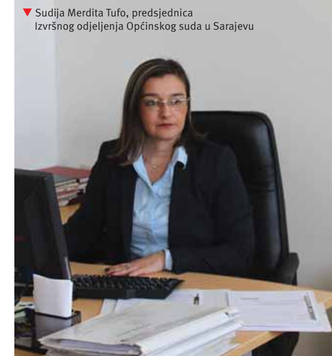
▼ Sudija Merdita Tufo, predsjednica Izvršnog odjeljenja Općinskog suda u Sarajevu