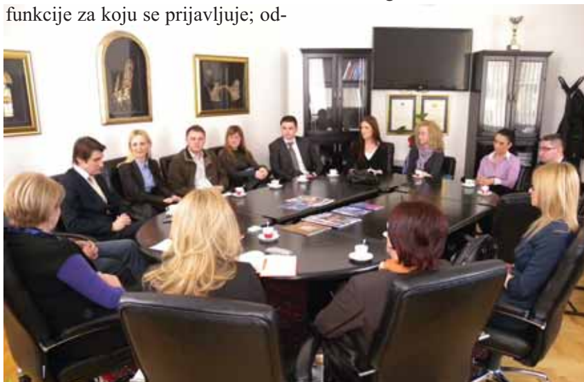
▲ Novoimenovani stručni saradnici

Novoimenovane sudije i stručni savjetnici na dužnost su stupili 1. 04.2013. godine. ■