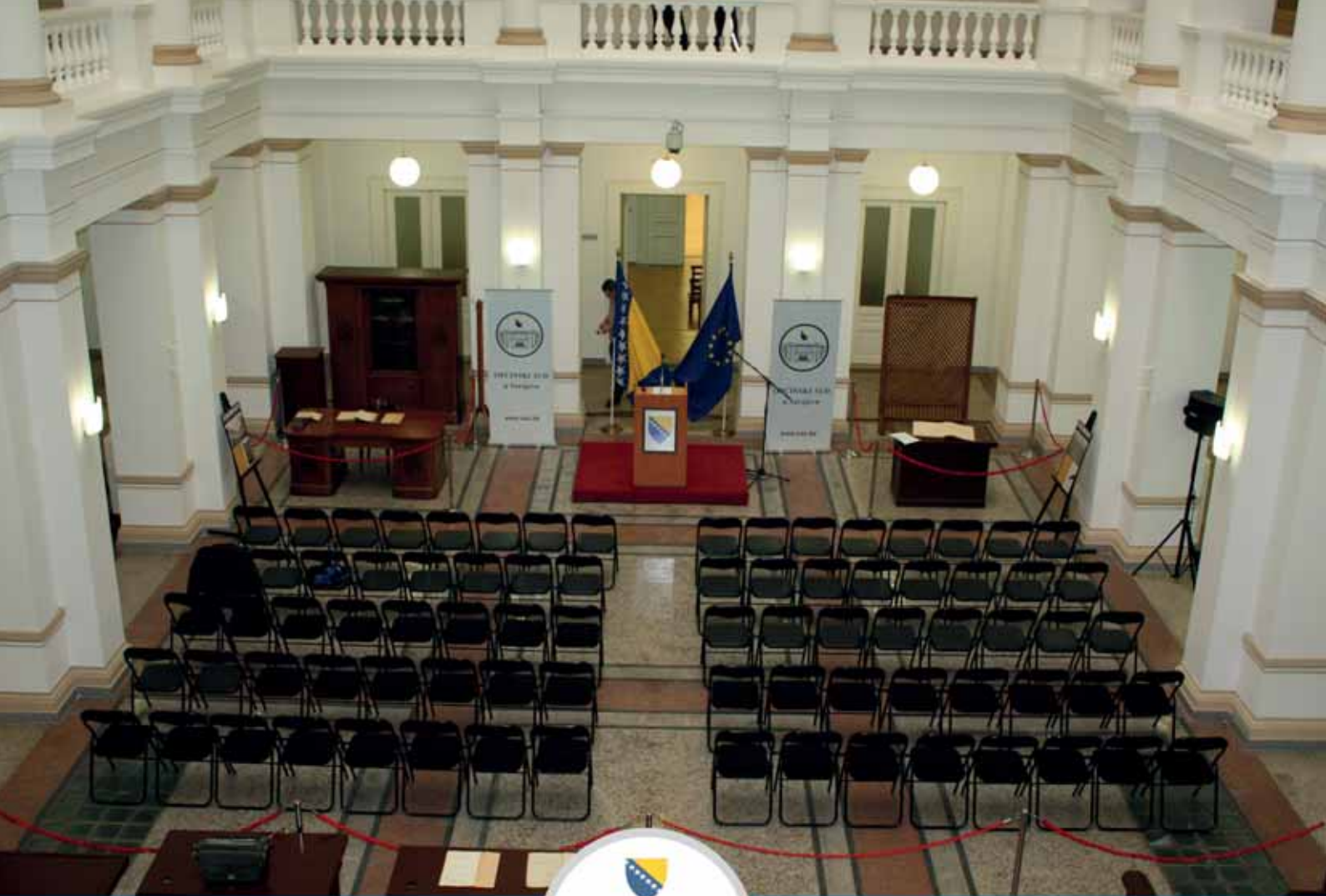
Općinski sud u Sarajevu