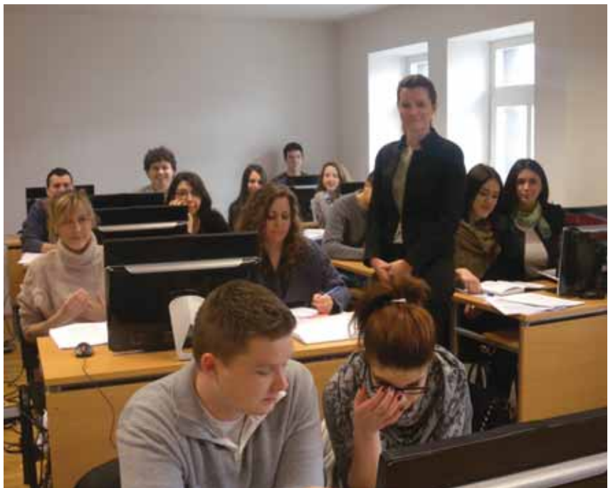
▲ Studenti sa profesoricom

Već po drugi put do sada Općinski sud u Sarajevu je 27.03.2013. godine ugostio 24 studenta sa Univerziteta u Sarajevu, Mostaru, Banjoj Luci i Tuzli. Studenti su bili učesnici predavanja o Komparativnom ustavnom pravu i Pravu EU, a sve u organizaciji Ambasade Malte u BiH te Pravnog fakulteta Becerius iz Hamburga (Njemačka). Predavanja za studente održana su u jednoj od edukativnih sala Općinskog suda u Sarajevu. Studenti su tom prilikom imali mogućnost da kroz intenzivne lekcije, diskusiju i analizu velikog broja sudskih predmeta u Evropi, Americi, Južnoj Africi i drugim zemljama prošire svoja znanja iz oblasti Ustavnog i EU prava. ■