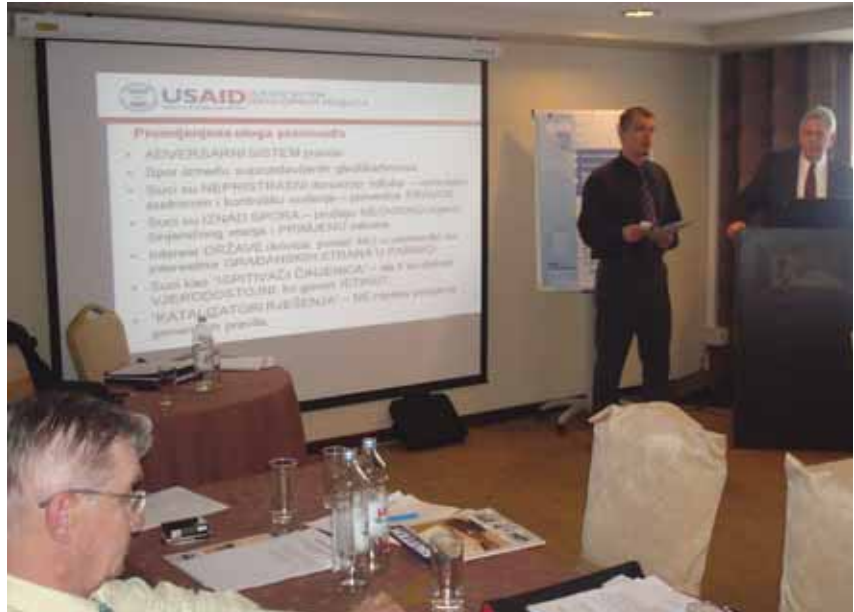
▲ Detalji sa održanog sastanka

dova čiji je cilj efikasniji i ekonomičniji rad suda, smanjenje broja zaostalih predmeta, unapređenje pristupa sudu i ostvarenja pravde, razmjena iskustava, definisanje aktuelnih problema u pravosuđu i društvu uopšte te informisanje nadležnih institucija i sredstava informisanja o istim. Na sastanku učestvuju predsjednici sudova i sudskih odjeljenja oba suda, rukovodioci sudske uprave, predstavnici Visokog sudskog i tužilačkog vijeća Bosne i Hercegovine te predstavnici međunarodnih organizacija i donatora pravosudnog sistema BiH. ■