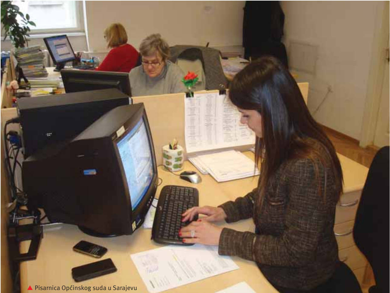
▲ Pisarnica Općinskog suda u Sarajevu

ovom Odjeljenju iznosio je ukupno 2.627, a na kraju godine ostalo je neriješenih 2.718 predmeta. Privrednih sporova, kao neriješenih predmeta, u pomenutom periodu bilo je 2.215 dok je u toku godine zaprimljeno je 2.363, riješeno 2.210 i na kraju godine je ostalo neriješenih 2.368 predmeta.