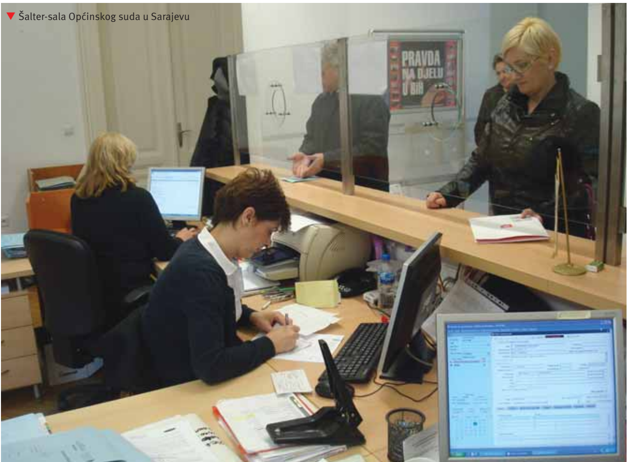
▼ Šalter-sala Općinskog suda u Sarajevu

Posebna pažnja na Odjeljenju posvećena je radu i rješavanju starih, kao i zaostalih predmeta, a u skladu sa Uputstvom Viskog sudskog i tužilačkog vijeća BiH. Iz evidencije o broju starih predmeta je vidljivo da su sudije smanjile broj starih neriješenih predmeta, što je rezultat izuzetnih napora u savladavanju propisane mjesečne norme te su sudije Parničnog odjela u stalnom nastojanju da se savlada i tekući priliv predmeta, da se smanje zaostaci u broju neriješenih predmeta te se kontinuirano radi na prebačanju norme. ■