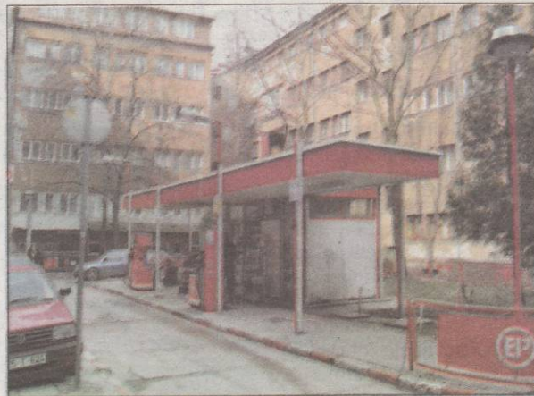
Rad pumpe nezakonit?

Općinski sud je sa Općinom Centar i Kantonalnim sudom zatražio da se upute na teren nadležne in-